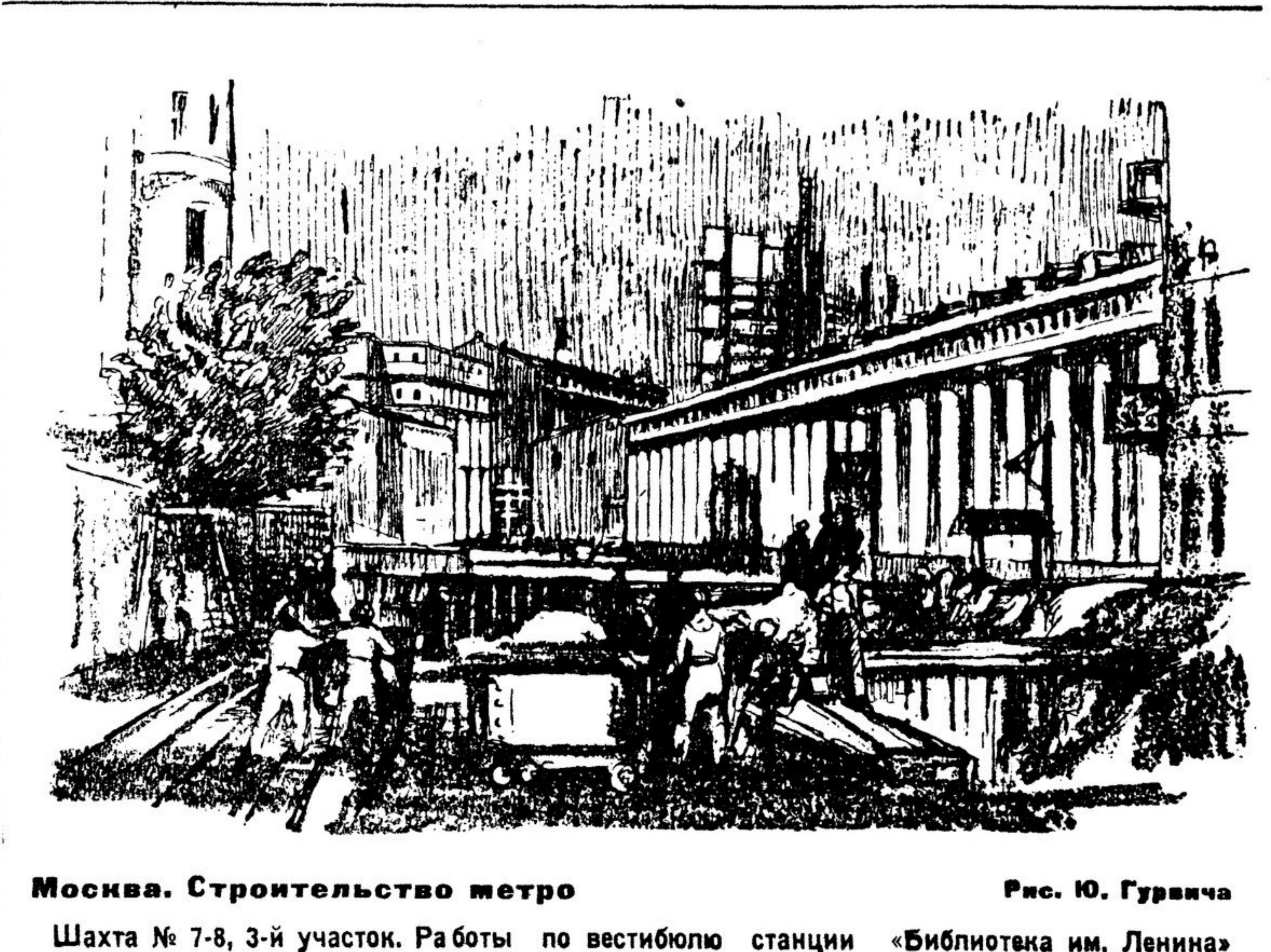
Москва. Строительство метро. Рис. Ю. Гуравича. Шахта № 7-8, 3-й участок. Работы по вестибюлю станции «Библиотека им. Ленина»